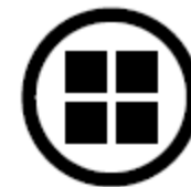
Uzavřená tabulka s dělenou hlavičkou