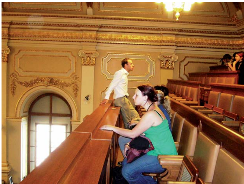
Návštěva v Poslanecké sněmovně v Praze