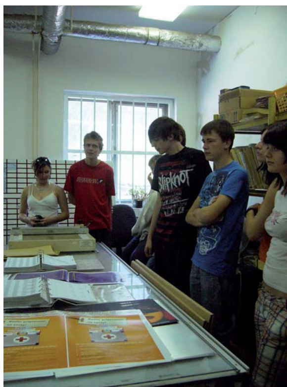
Exkurze v tiskárně Apolys v Praze