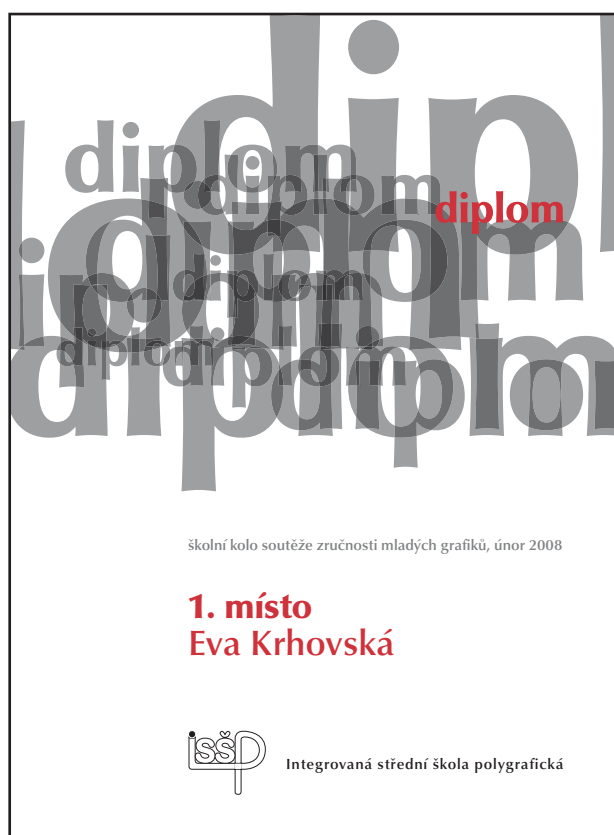
Školní kolo soutěže zručnosti mladých grafiků, diplom