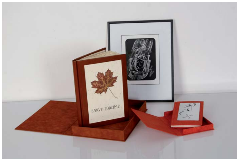
Soutěž zručnosti mladých knihařů, výrobky, 1. místo kategorie A