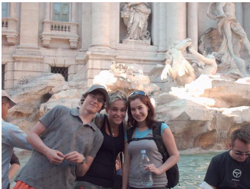
Poznávací zájezd do Itálie (Řím)