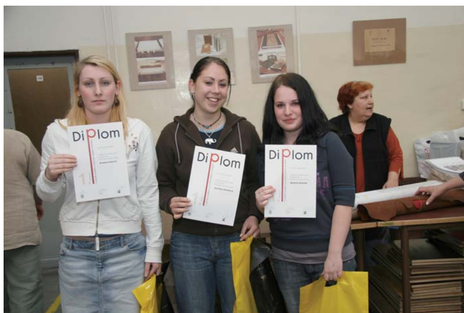
Soutěž zručnosti mladých knihařů, naše družstvo, 1. místo kategorie A