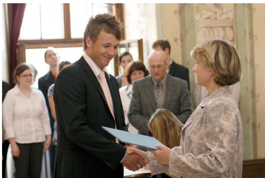
Slavnostní předávání maturitních vysvědčení