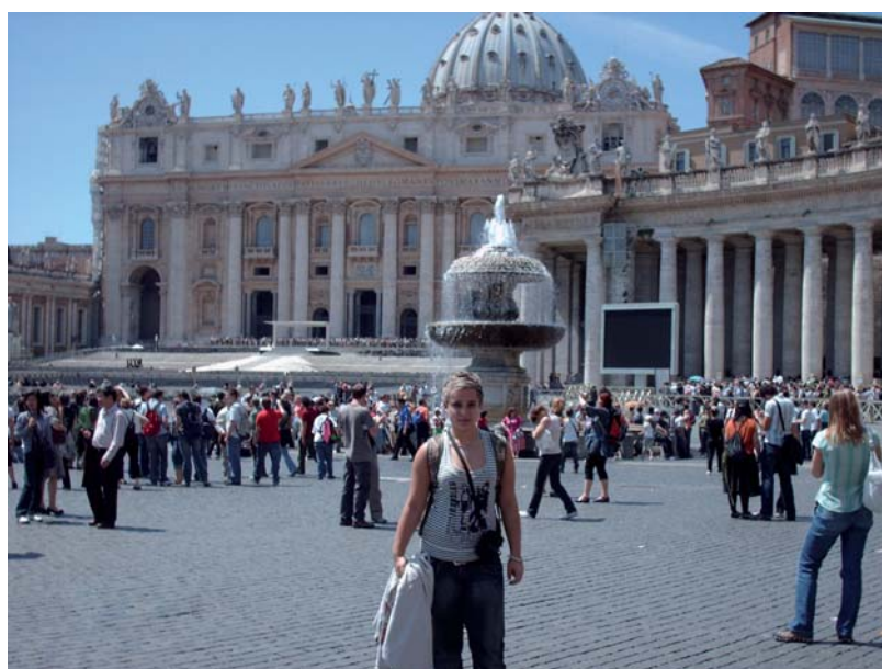
Poznávací zájezd do Itálie (Vatikán, nám. sv. Petra)