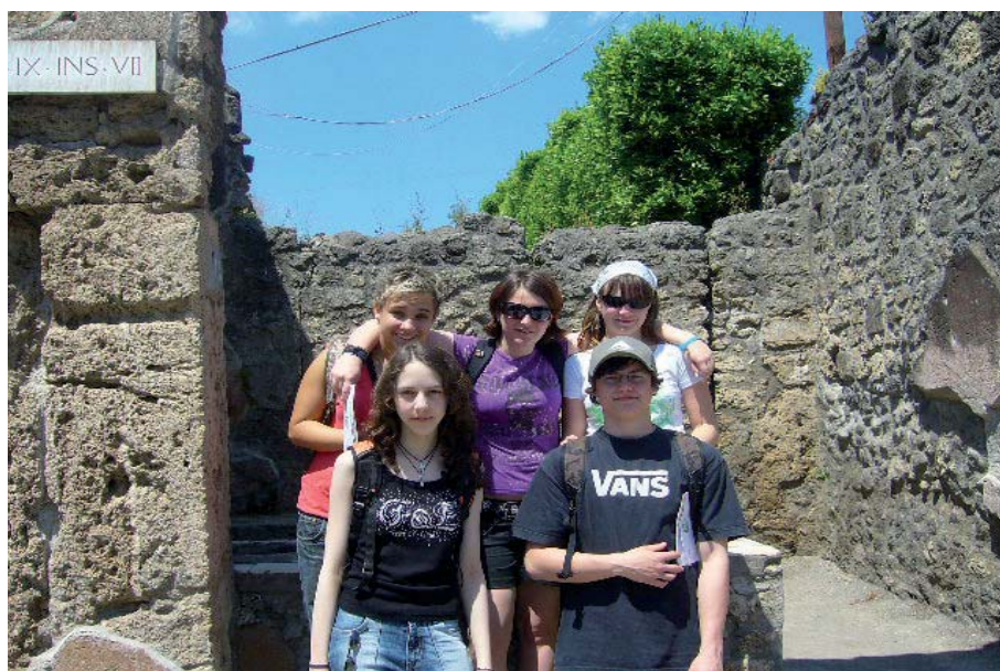
Poznávací zájezd do Itálie (Pompeje)