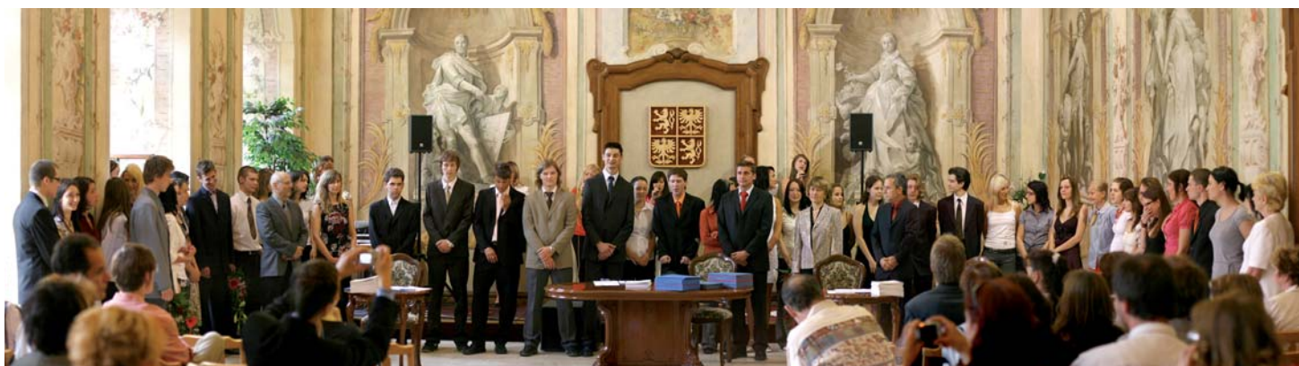
Slavnostní předávání maturitních vysvědčení

Ve školním roce 2007/2008 nebyla provedena inspekční činnost Českou školní inspekcí