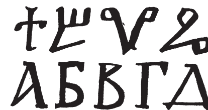
Hlaholice a kyrilice

Ruská azbuka vychází z kyrilice, která se na Ukrajině a v Rusku již vyvíjela samostatně. Sloužila hlavně k psaní náboženských knih a textů. Říkalo se jí ustav . V roce 1708 nechal car Petr Veliký písmo zjednodušit podle latinkových vzorů v novou občanskou abecedu a nazval ji graždanka . Ta se používá v podstatě dodnes.