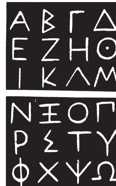
Řecká abeceda z r. 394

Od Řeků přijala písmo celá Evropa. Při porovnání zřetelně vidíme, že latinka i azbuka se vyvíjely ze stejného základu.